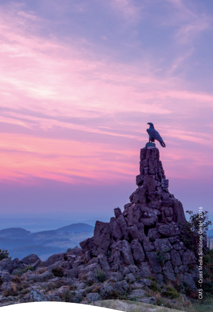
CMS - Cross Media Solutions GmbH 2016